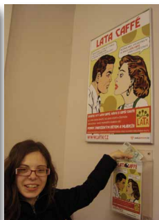
Lata koutek ve Friends Coffee House