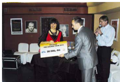
Galavečer Golden Tour