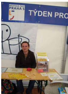
Týden pro neziskovky na Praze 5

Akreditace dobrovolnické služby byla Minister- stvem vnitra obnovena 16.12.2008.