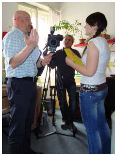
Natáčení ČT v Latě