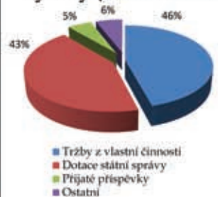
Výnosy (22 462 tis. Kč)

Uvádíme zde vybrané údaje z účetní závěrky. Kompletní účetní závěrka ve složení: rozvaha, výkaz zisku a ztráty a příloha k účetní závěrce je součástí výroční zprávy, která je zveřejněna ve sbírce listin vedené příslušným rejstříkovým soudem.